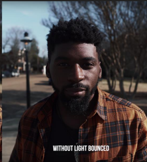
Sin luz rebotada