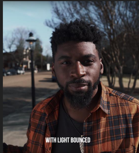
Con luz rebotada